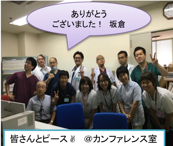
皆さんとピース ♪ @カンファレンス室