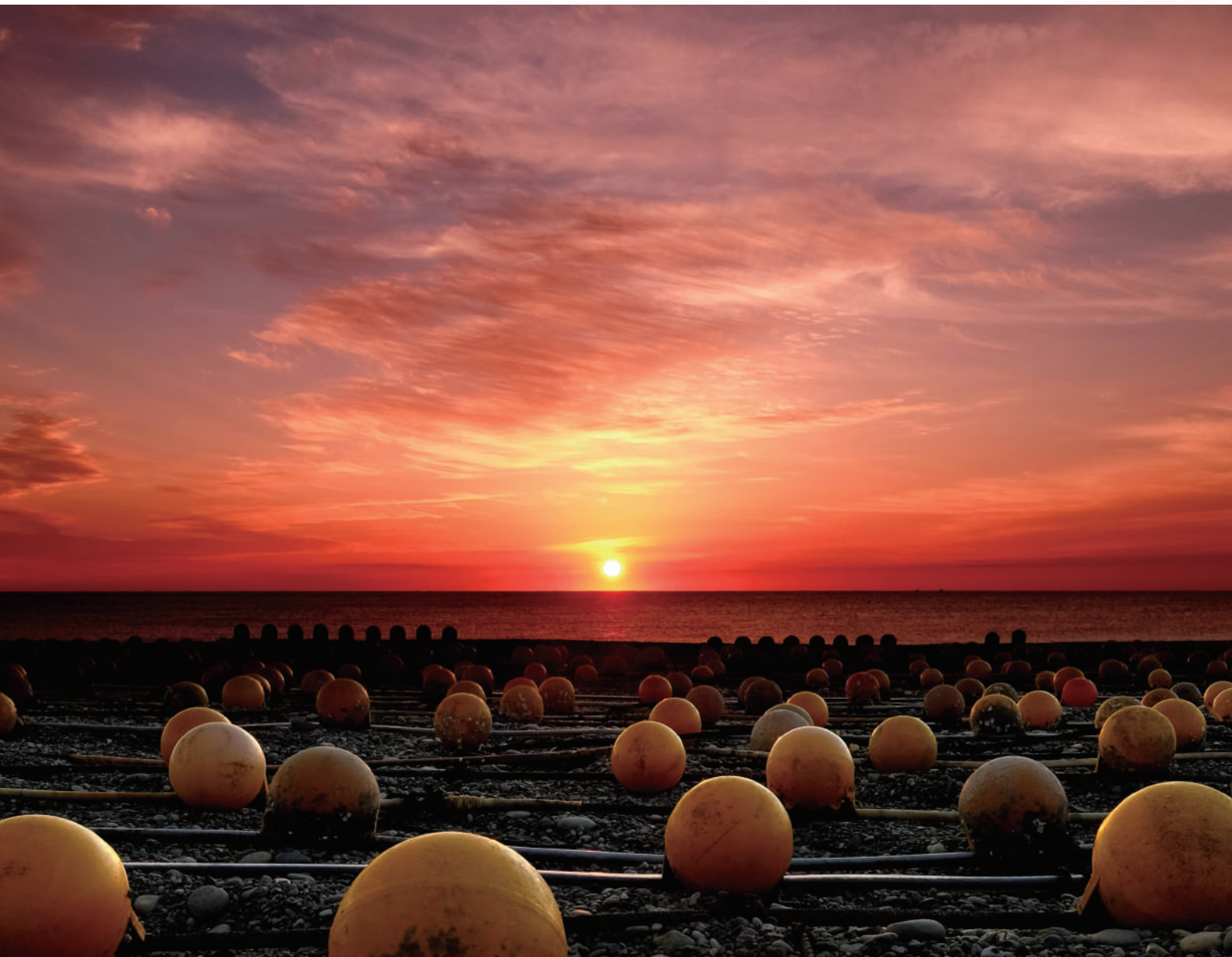
阿田和海岸(御浜町)