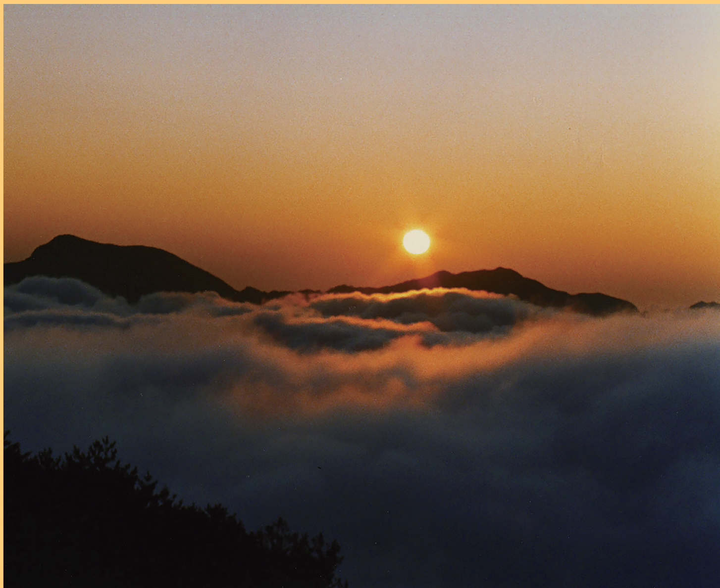
来光（熊野市 ツエノ峰）

紀南病院スローガン 令和7年1月 成長し続ける人は ただ実行するだけでなく 考えて工夫し続ける人の事である 2月 話し方ひとつで 伝わるメッセージは変わる 3月 みんなに届けよう あいさつ 笑顔 思いやり